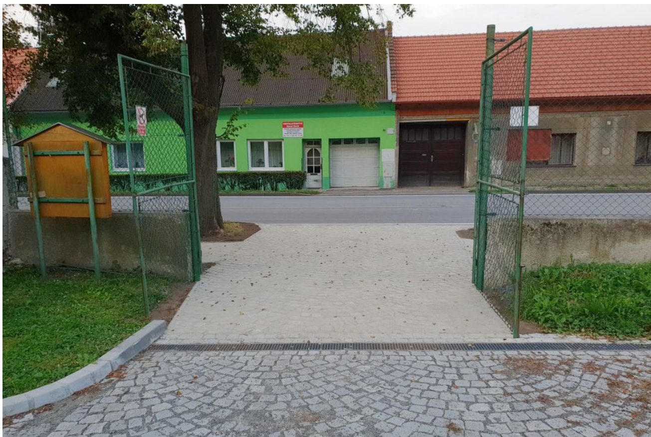
Předláždění vjezdu ke školní jídelně z ulice Podvalí