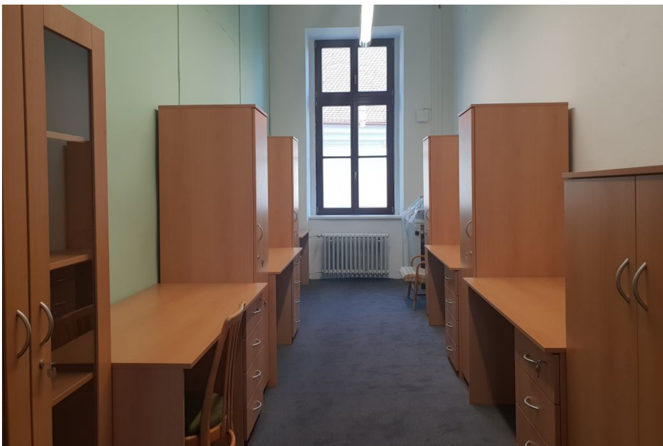
Modernizace kabinetu asistentek pedagoga